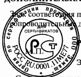
Схема сертификации № За Указанное соответствие по ГОСТ Р 50460-92 наносится на изделие и на товарно-опроводительные документы