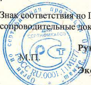
Схема сертификации № 3

Знак соответствия по ГОСТ Р 50460-92 наносится на изделие и на товарно-сопроводительные документы