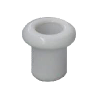
Материал: керамика Размер: 17x25 мм Цвет: белый R-VT-21