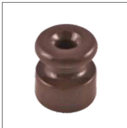
Материал: керамика Размер: 18x20 мм Цвет: коричневый B1-551-02