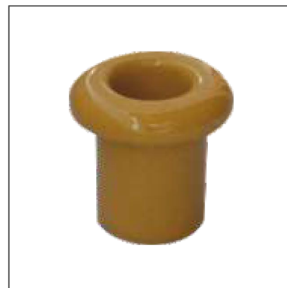
Материал: керамика Размер: 17x25 мм Цвет: золото R-VT-19