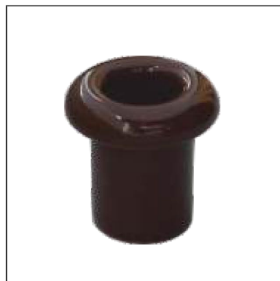
Материал: керамика Размер: 17x25 мм Цвет: коричневый R-VT-20