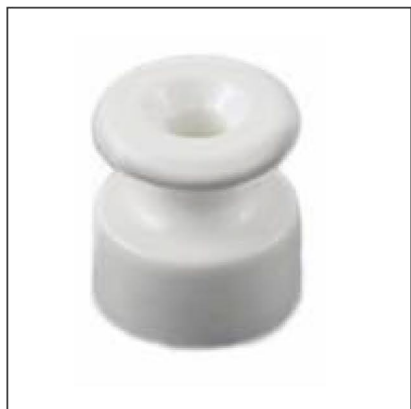
Материал: керамика Размер: 18x20 мм Цвет: белый B1-551-01